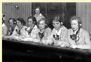
Telefonistinnen damals in Deutschland.