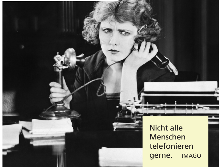
Nicht alle Menschen telefonieren gerne.

Die Unmittelbarkeit überfordert. Ein Telefonat verlangt Präsenz, schnelle Entscheidungen und klare Formulierungen. Das ist anspruchsvoller als eine E-Mail. Jüngere Menschen sind mit asynchroner Kommunikation aufgewachsen, die mehr Kontrolle erlaubt. Unser Stil ist insgesamt vorsichtiger und stärker kuratiert geworden. Das spontane Gespräch passt nicht immer dazu.