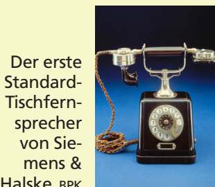
Der erste Standard-Tischfernsprecher von Siemens & Halske.