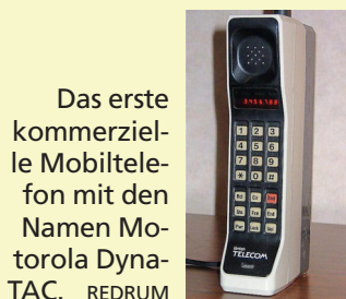
Das erste kommerzielle Mobiltelefon mit den Namen Motorola DynaTAC. REDRUM