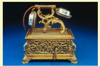
Ein früher Luxus-Fernsprechtischapparat.