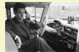
Ein frühes Autotelefon.