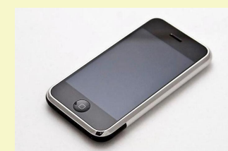
Das erste iPhone wird vorgestellt. CARL BERKELEY