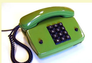
Einführung der Tastentelefone. NIGHTFLYER